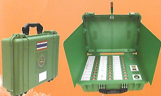
เครื่องลงคะแนน

โปร่งใส ใช้งานง่าย รู้ผลไว เปลี่ยนจากการกา X มาเป็นการกด