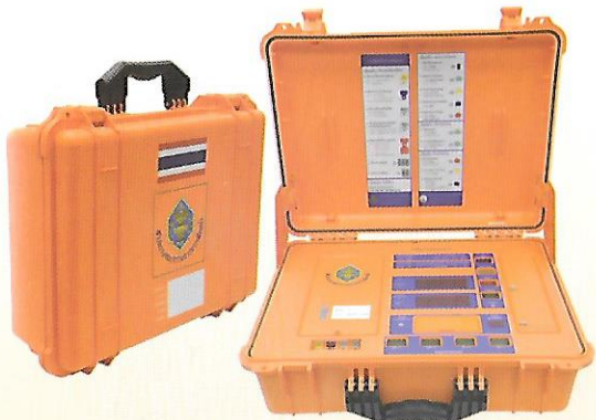
เครื่องรวมคะแนน