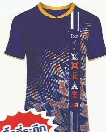
เสื้อที่ระลึก