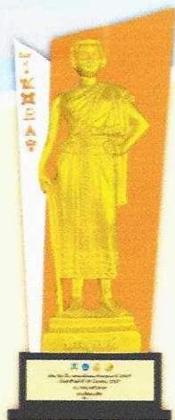
โล่รางวัล ผู้ว่าราชการจังหวัดนครราชสีมา