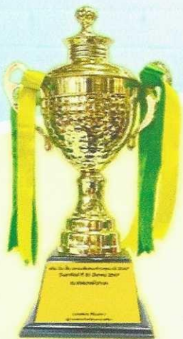
ชิงถ้วยรางวัลเกียรติยศ ผู้ว่าราชการจังหวัดนครราชสีมา (OVER ALL)

Start : ตลาดน้ำบึงห้วยทะเล เทศบาลตำบลห้วยทะเล