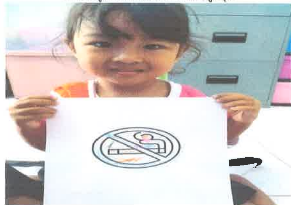
ทำกิจกรรมเสริมความรู้ผ่านการระบายสี