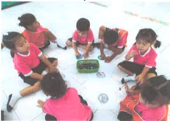
ทำกิจกรรมเสริมความรู้ผ่านการระบายสี