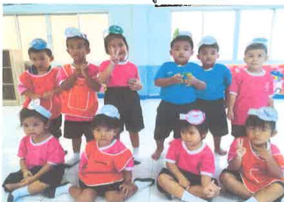
ทำกิจกรรมเสริมความรู้ผ่านการระบายสี