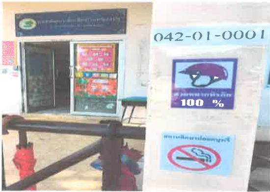
ติดป้ายสัญลักษณ์ห้ามสูบบุหรี่บริเวณสถานศึกษา

ศูนย์พัฒนาเด็กเล็กองค์การบริหารส่วนตำบลหนองจะบก (บ้านหนองปรู) การขับเคลื่อนมาตรการสถานศึกษาปลอดบุหรี่