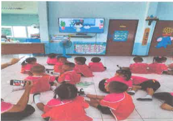
อบรมให้ความรู้ผ่านสื่อออนไลน์