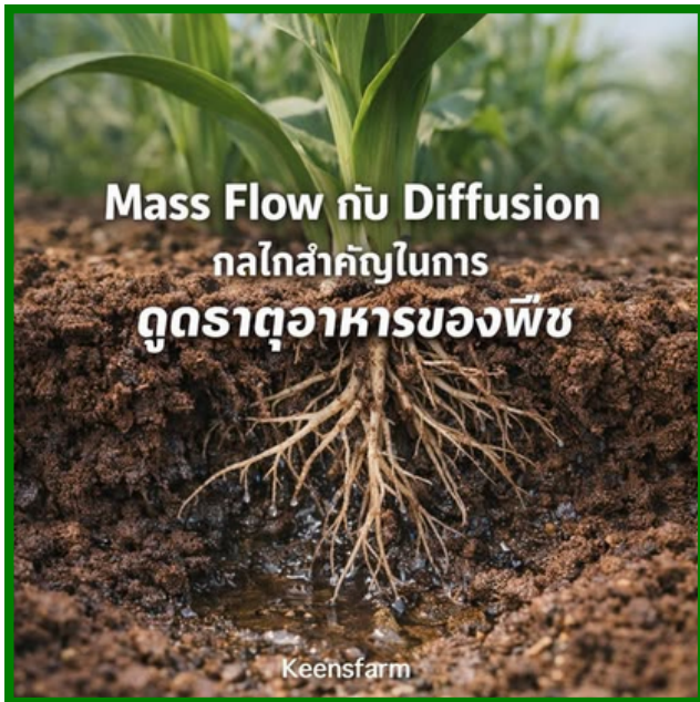
Mass Flow กับ Diffusion กลไกสำคัญในการ ดูดธาตุอาหารของพืช